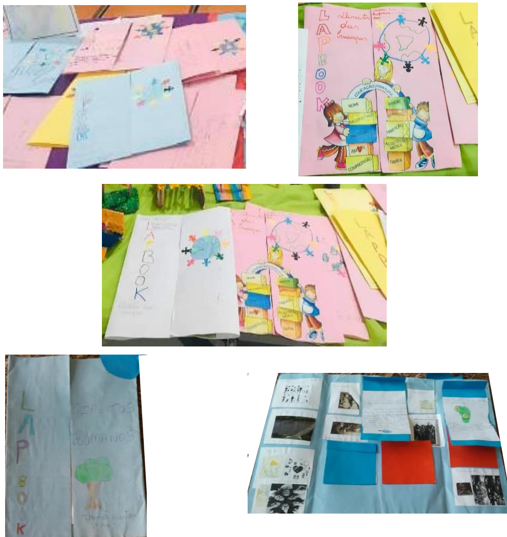
Imagem 02: Registros de Lapbooks sobre Direitos Humanos construídos por alunos do 3º Ano dos Anos Iniciais do Ensino Fundamental da Escola Estadual Marechal Castelo Branco – Uberlândia/MG.

criação do lapbook sobre Direitos Humanos os alunos fizeram desenhos, recortes de revistas, textos e dobraduras conforme representados na Imagem 02.